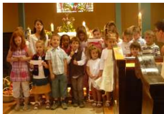
Participation des enfants de l'école du dimanche