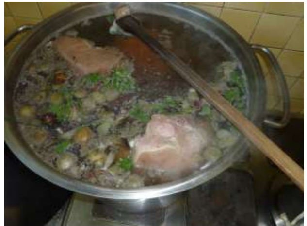
Vue sur les jambons dans la marmite ! Un certain nombre de jambons cuisent dans cette grande marmite....

Question : A votre avis combien de jambon sont en train de cuire dans cette marmite en inox ? Pour le gagnant : Une bouteille de vin ! Tel au 03 88 07 71 37