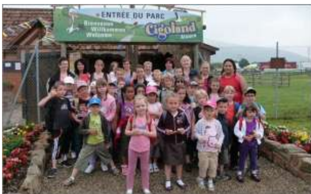
Sortie à Cigoland de l'école du dimanche