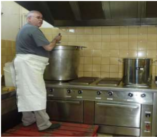
Le cuisinier surveillant les jambons dans la grande marmite !