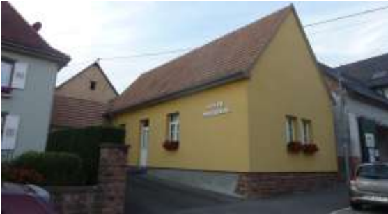
Foyer paroissial (Vue depuis la rue principale)

Le Foyer protestant, un vrai lieu de vie, où se passent de nombreuses activités culturelles et cultuelles !