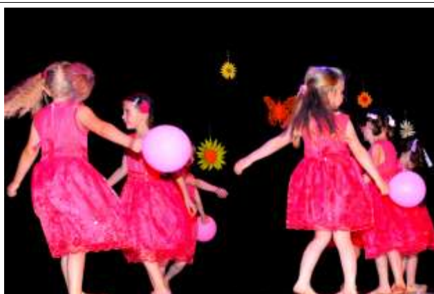
Atelier d'éveil à la danse spectacle du 30 juin 2012 Ballonnette et les petites danseuses