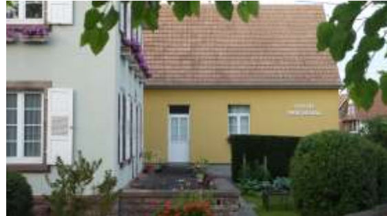
Foyer paroissial (Vue depuis la rue de la mairie)