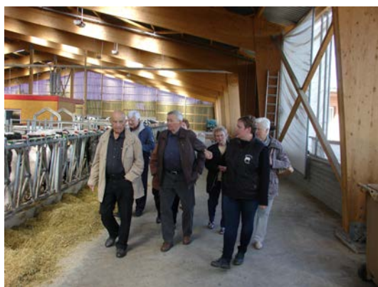
d'une étable moderne à Pfaffenhoffen