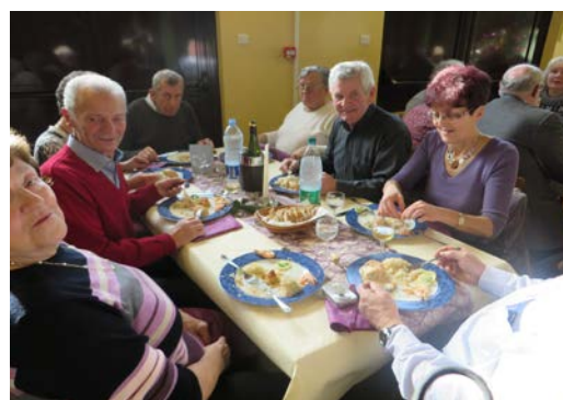
Succulent repas de Noël intergénérationnel

Des jeunes se mobilisent pour soutenir les moins jeunes