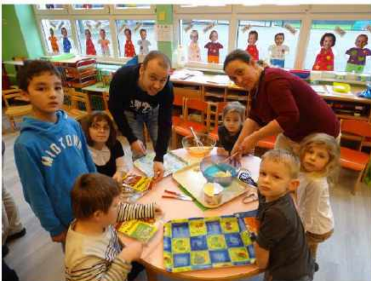
WRAPS AU SAUMON / FROMAGE