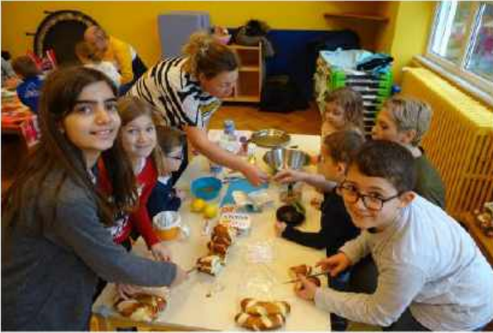
MALICETTES AUX RILLETTES DE THON