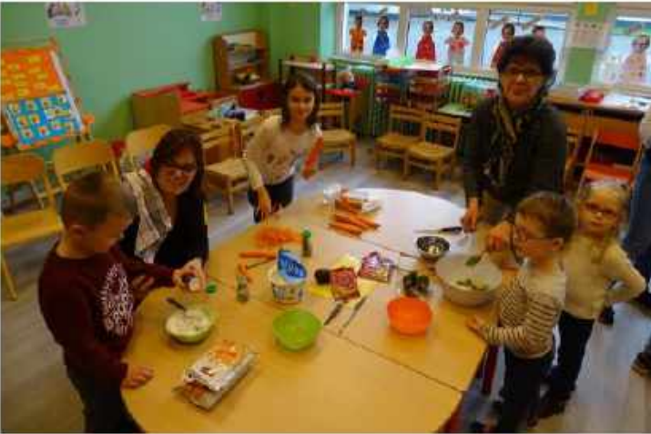
GUACAMOLE / LEGUMES CRUS