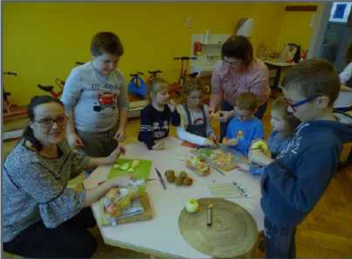
BROCHETTES DE FRUITS

Voici les recettes (4 recettes sucrées et 4 recettes salées) :