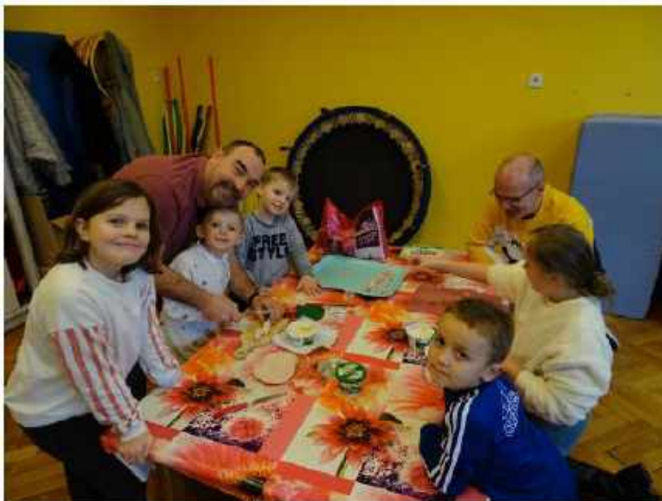
ROULES AU JAMBON / FROMAGE